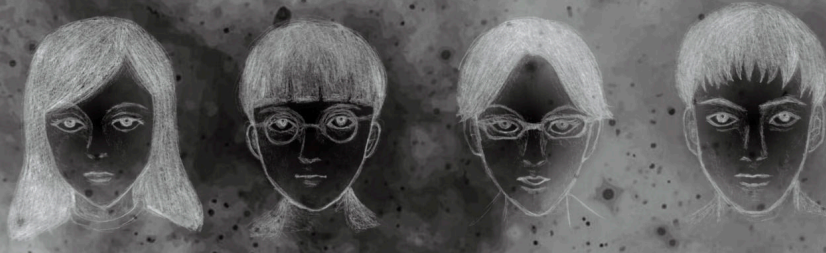
イラスト ▶ ばんかおり